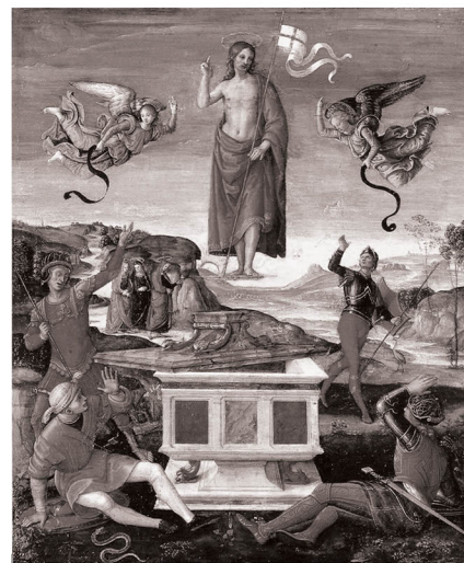
Rafael Santi - Zmartwychwstanie