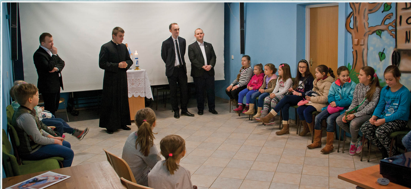
21 marca 2016r. Rekolekcje Wielkopostne dla dzieci szkolnych.