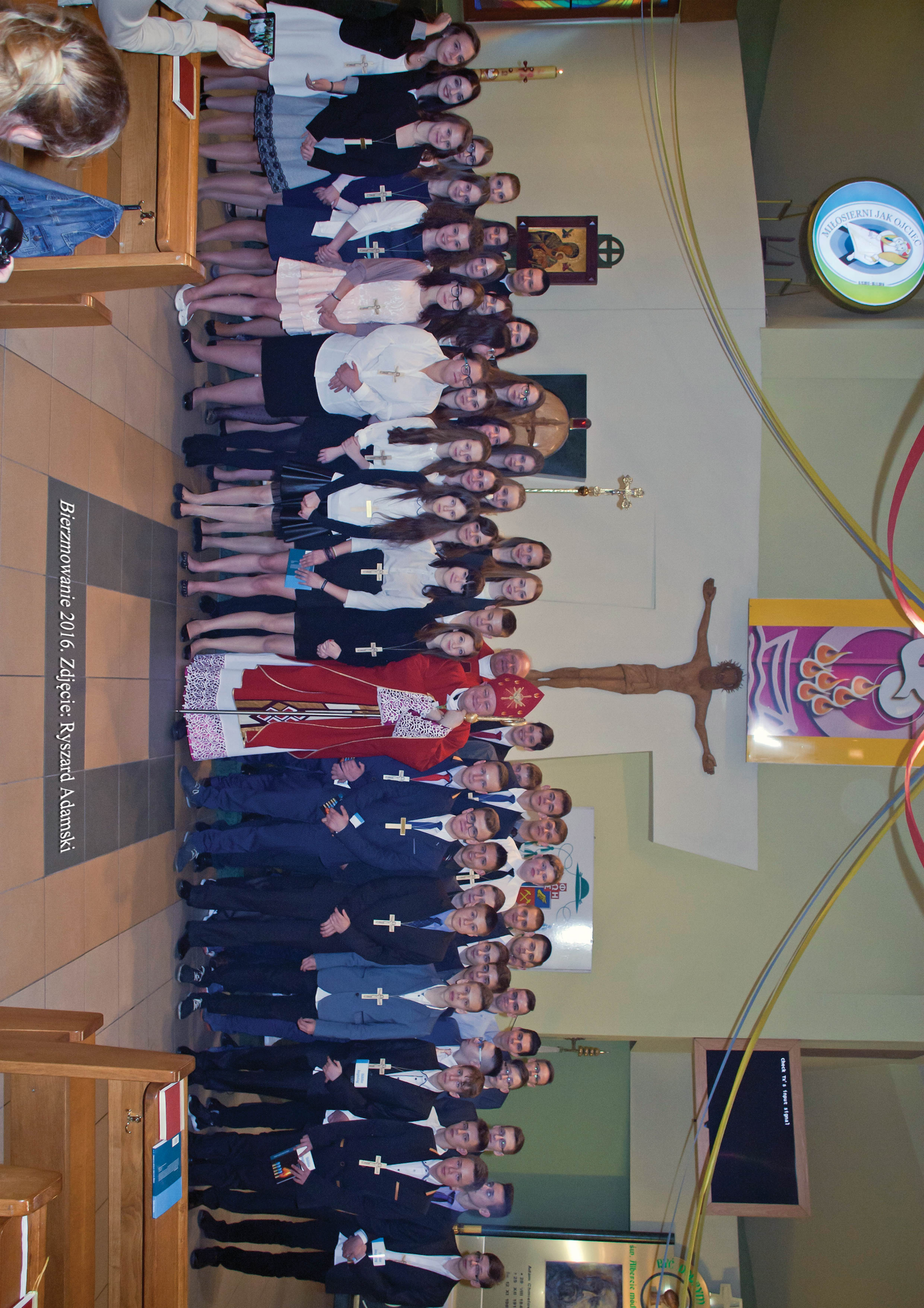
Bierzmowanie 2016.