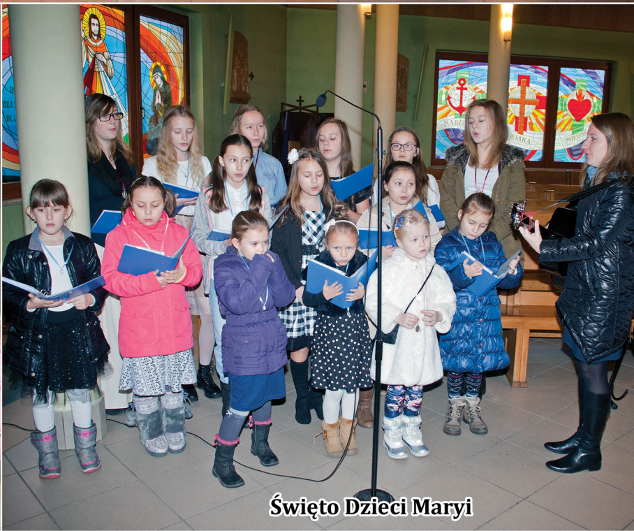
Święto Dzieci Maryi